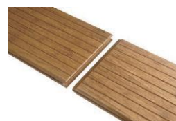
Nut + Feder zur Endlosverlegung